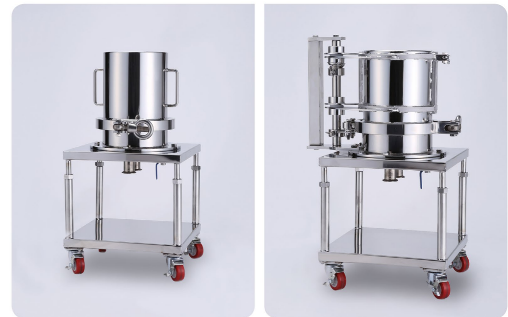
MH Type (해당 제품의 전용 하우징은 96 Page를 참조 바랍니다.)